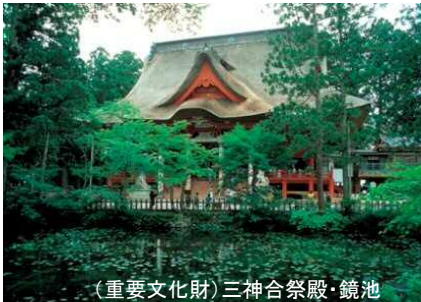
(重要文化財)三神合祭殿・鏡池