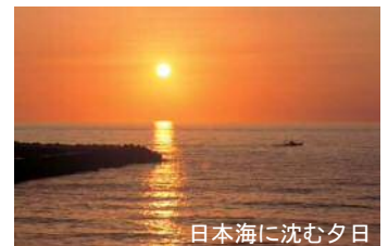
日本海に沈む夕日