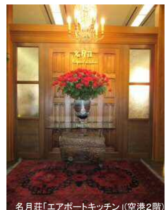
名荘「エアポートキッチン」(空港2階)

復路は、蔵王温泉、天童温泉、銀山温泉、さくらんぼ東根温泉等から、山形空港（観光）ライナー・バスもご利用いただけます！ http://www.yamagata-airport.co.jp/access/liner.html