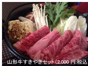
山形牛すきやきセット(2,000円.税込)