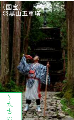
(国宝)羽黒山五重塔